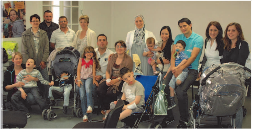
Parents ou grands-parents d'enfants A-TRX, tous dans la joie de se rassembler, comme des membres d'une même famille, une famille Xtraordinaire.